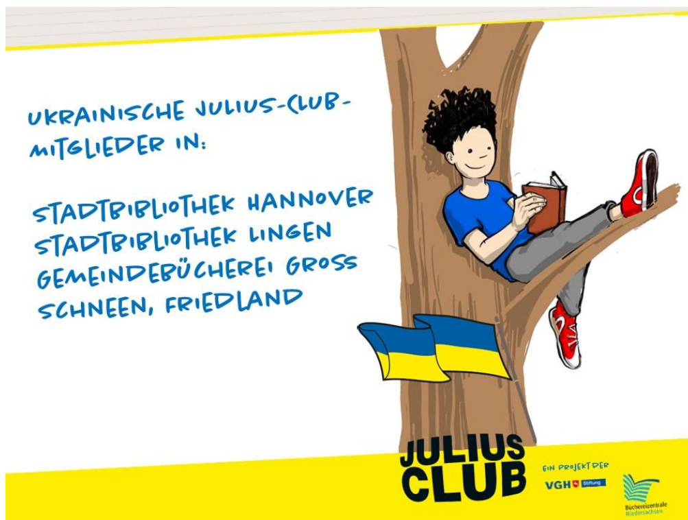
Abbildung 1: JULIUS-CLUB-Bibliotheken 2022 mit ukrainischen Teilnehmer:innen