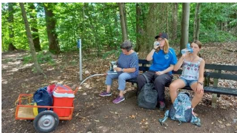
Picknick im Wald