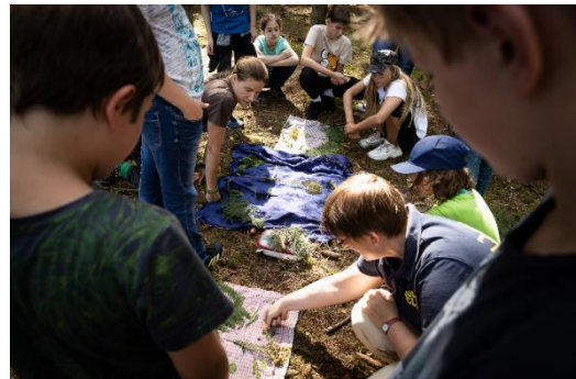
Mediothek Diepholz zu Besuch bei der Wildnisschule Schattenwolf in Bassum